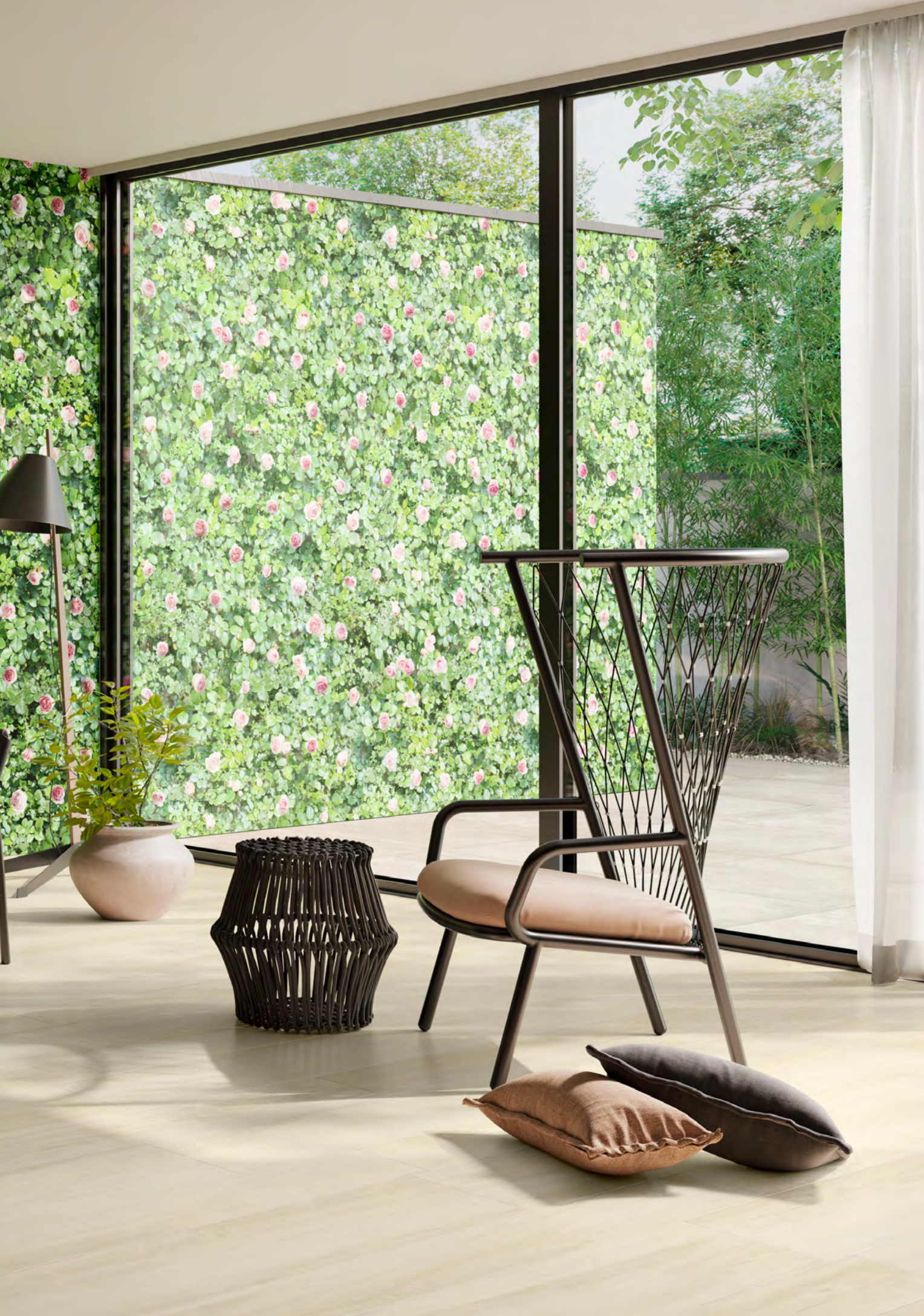
WALL: coral rose cm 120x278 - 47 1/4 "x109 1/2 "