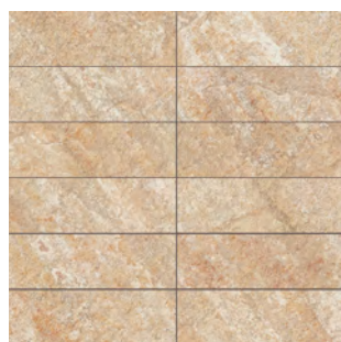
mosaico 5x15 ■

cm 30x30 - 11 3/4 "x11 3/4 " tessera cm 5x15 - 2"x5 7/8 " su rete on net sur trame auf Netz