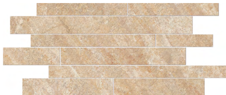
composizione A ■

cm 30x60 - 11 3/4 "x23 5/8 " su rete on net sur trame auf Netz