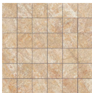
mosaico 5x5 ■

cm 30x30 - 11 3/4 "x11 3/4 " tessera cm 5x5 - 2"x2" su rete on net sur trame auf Netz