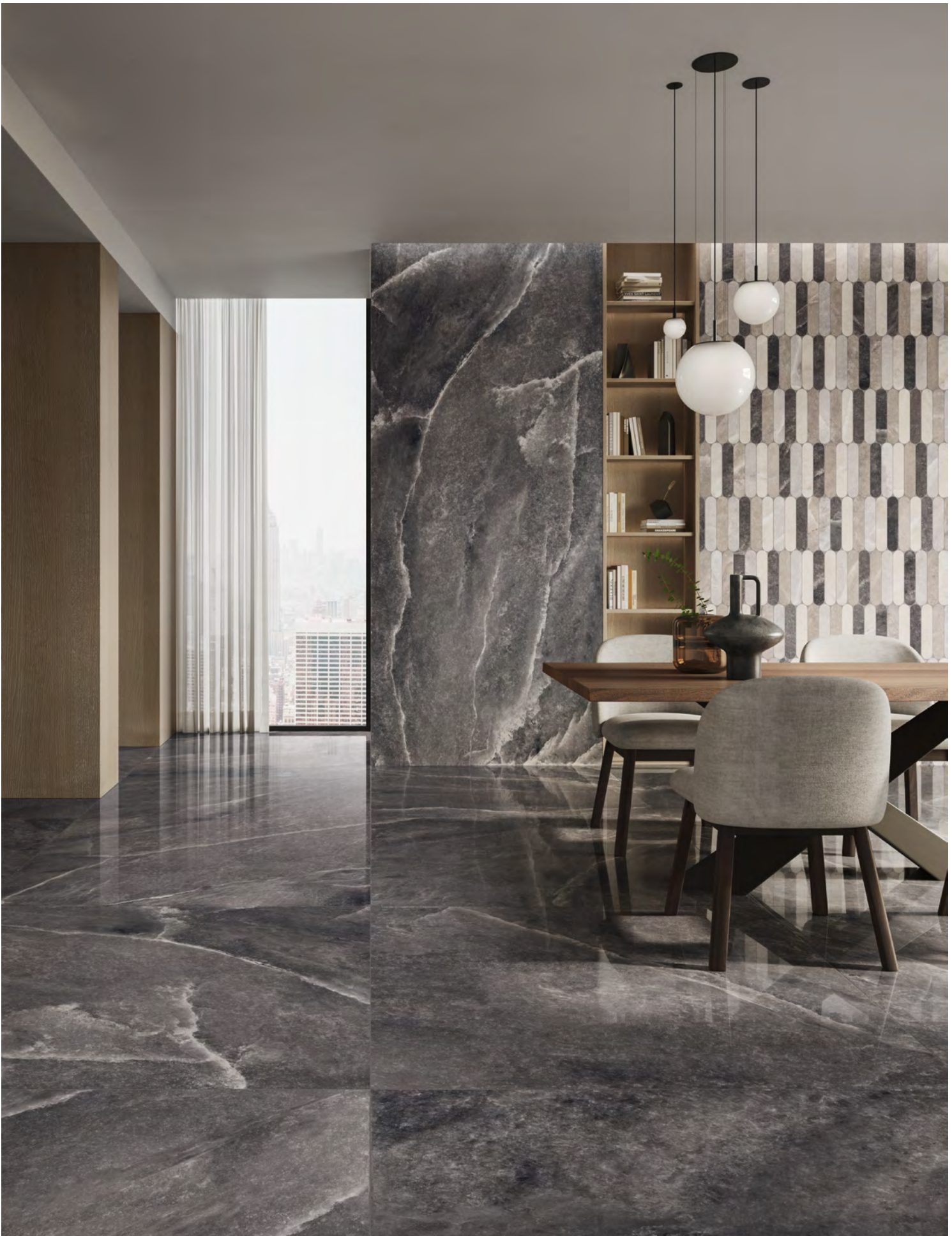
WALL: supreme dark naturale cm 120x278 - 47 1 / 4 "x109 1 / 2 ", mosaico Listelli cm 26,5x56 - 10 3 / 8 "x22" / FLOOR: supreme dark lucida cm 120x120 - 47 1 / 4 "x47 1 / 4 "