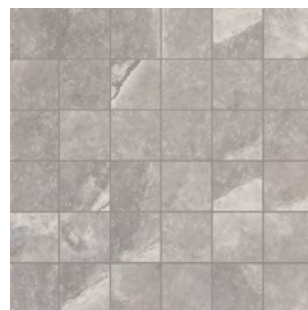
cm 30x30 - 11 3/4 "x11 3/4 " tessera cm 5x5 - 2"x2" su rete on net sur trame auf Netz mm 9