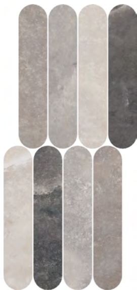
cm 26,5x56 - 10 3/8 "x22" su rete on net sur trame auf Netz mm 9