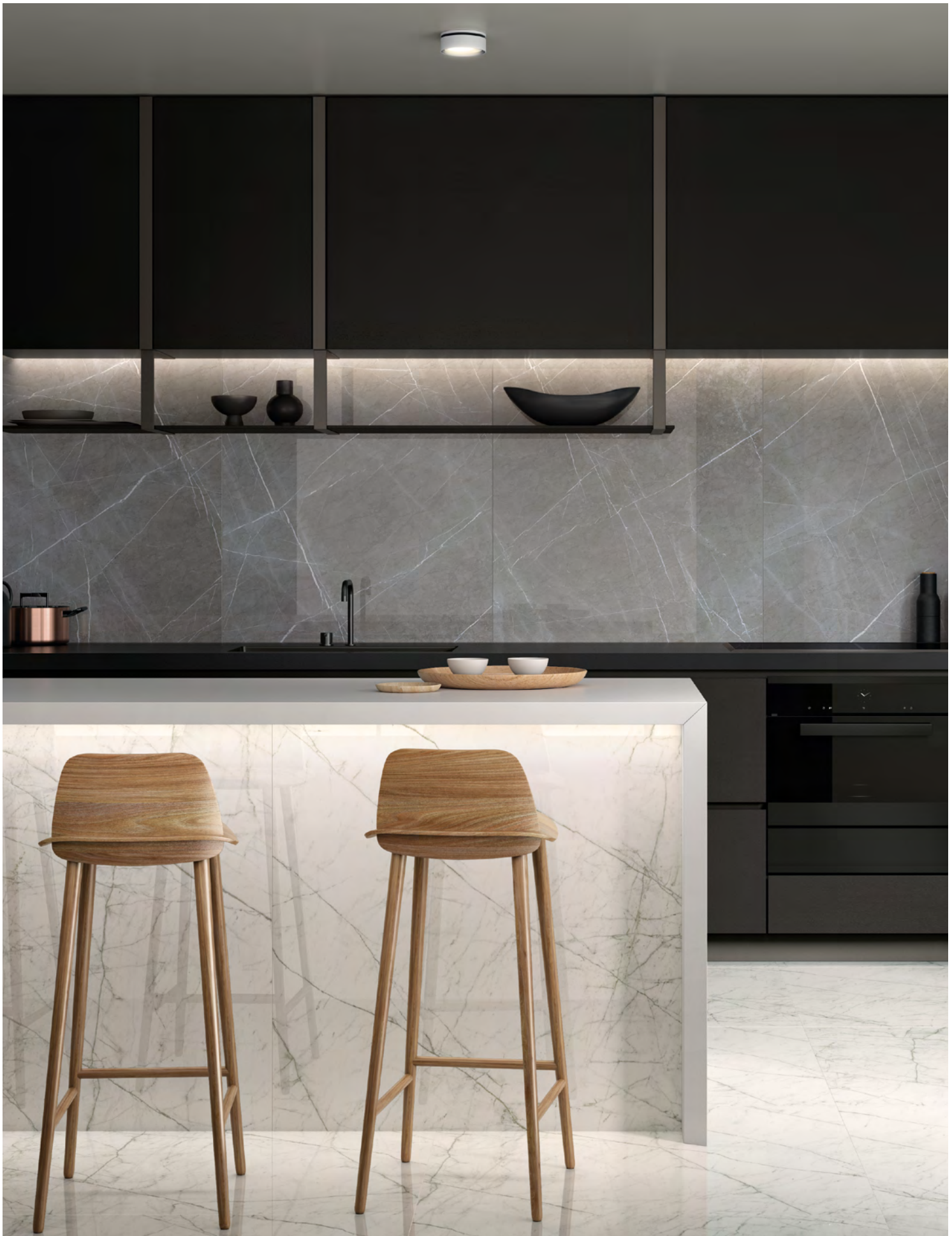
WALL: fossena smart lucida cm 90x270 - 35 3/8 "x106 1/4 " / FLOOR: statuarietto smart lucida cm 90x90 - 35 3/8 "x35 3/8 "