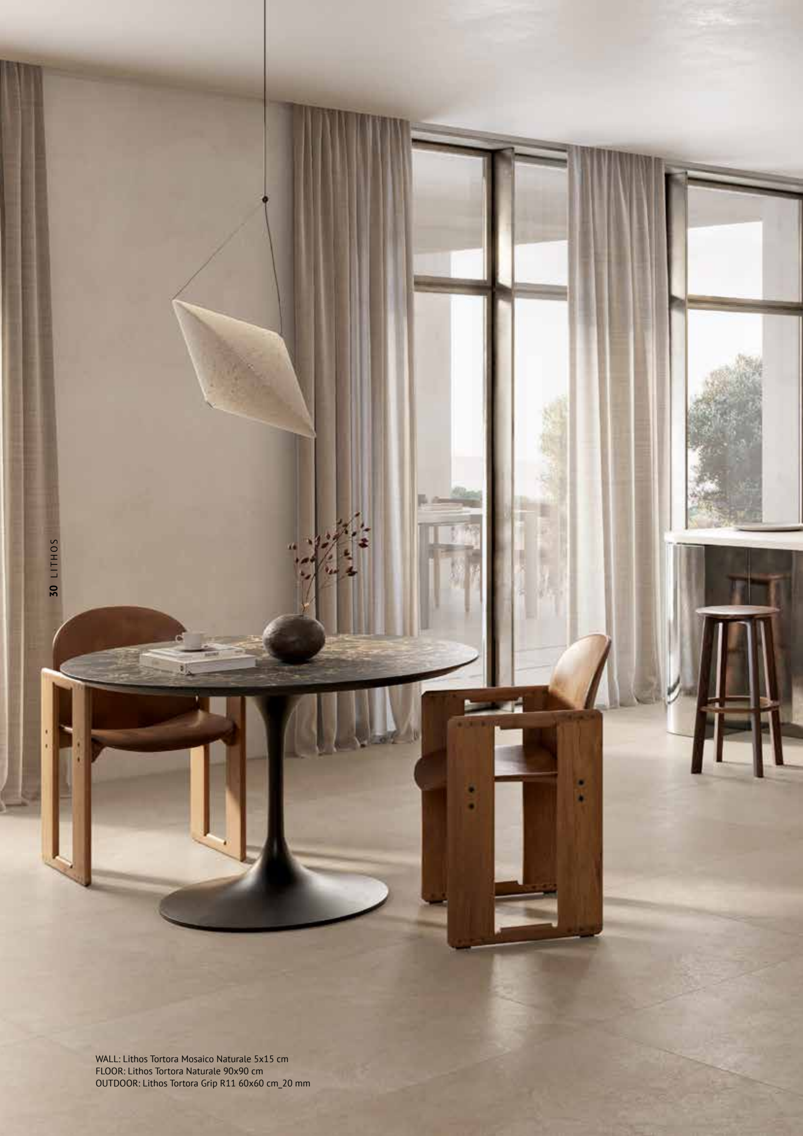
WALL: Lithos Tortora Mosaico Naturale 5x15 cm FLOOR: Lithos Tortora Naturale 90x90 cm OUTDOOR: Lithos Tortora Grip R11 60x60 cm_20 mm