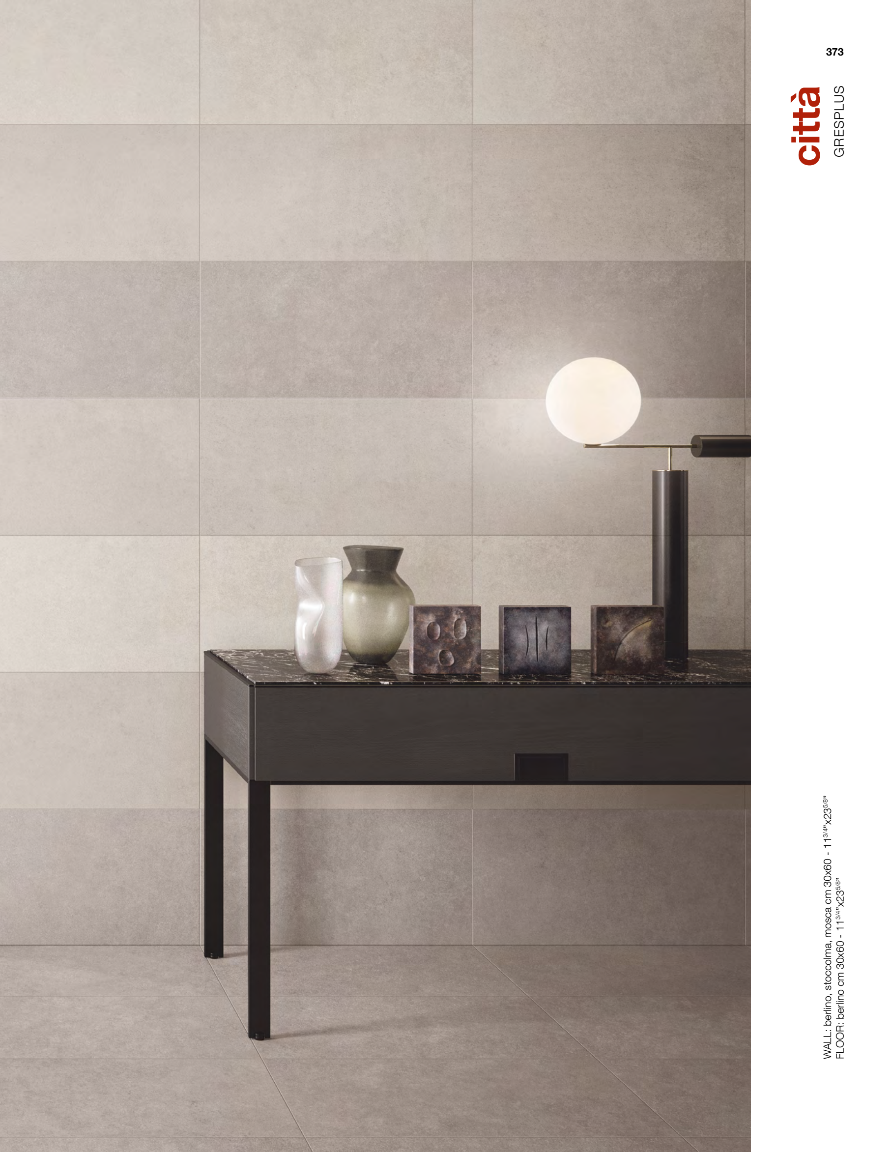
WALL: berlino, stoccolma, mosca cm 30x60 - 11 3/4 "x23 5/8 " FLOOR: berlino cm 30x60 - 11 3/4 "x23 5/8 "