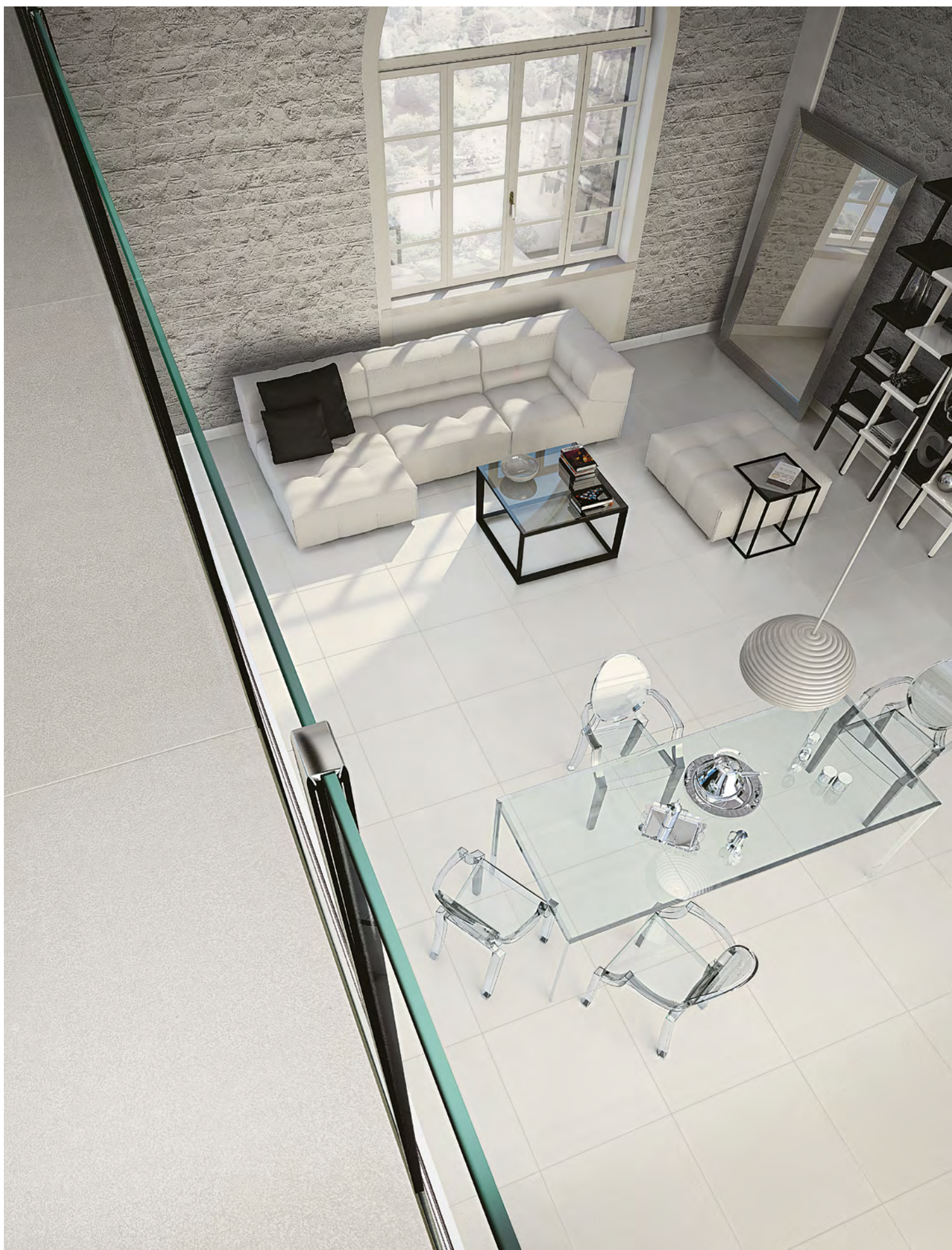
FLOOR: spazio bianco cm 60x60 - 23 5/8 "x23 5/8 "